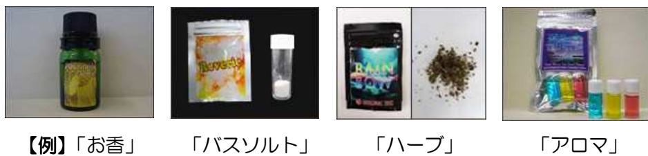
【例】「お香」「バスソルト」「ハーブ」「アロマ」

危険ドラッグは、法の網をくぐりぬける為 に「お香」「バスソルト」「ハーブ」「アロマ」等、 一見ただけでは人体摂取用と思われないよう 目的を偽装して販売されています。色や形状も 様々で、粉末・液体・乾燥植物など、見た目では わからないように巧妙に作られています。